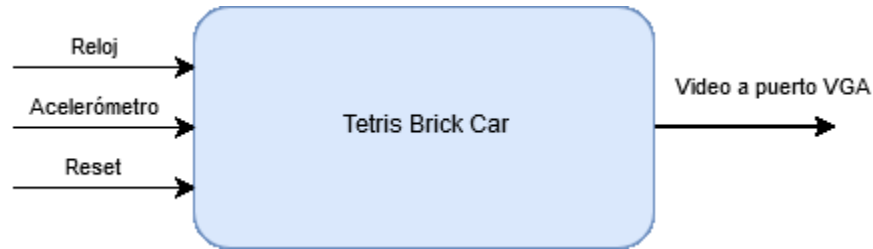
Diagrama de Bloques:

Recreación del juego mediante una interfaz VGA con controles de acelerómetro y gráficos mejorados.